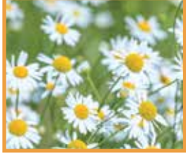
Hakiki Papatya ( Matricaria chamomilla )