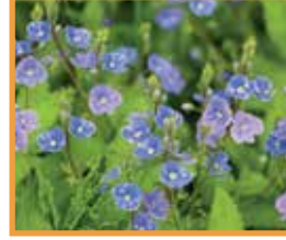
Yavşan Otu ( Veronica spp. )