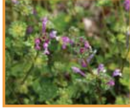
Ballıbaba ( Lamium amplexicaule )