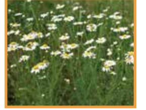
Hakiki Papatya ( Matricaria chamomilla )