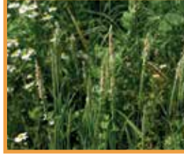
Tilki Kuyruğu ( Alopecurus myosuroides )