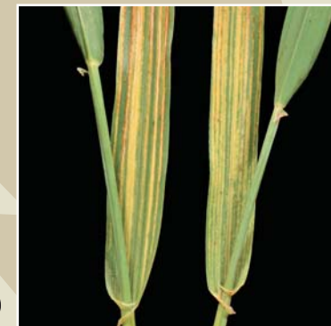
Yaprak çizgi hastalığı ( Pyrenophora graminea )