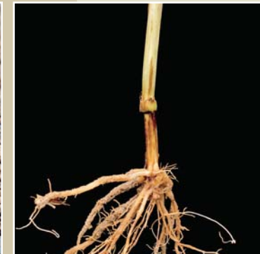
Kök ve kök boğazı çürüklüğü ( Fusarium spp. )