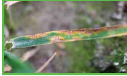
Septorya Yaprak Leke Hastalığı ( Septoria Tritici )