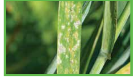
Tahıl Küllemesi ( Erysiphe graminis f. sp. Tritici )