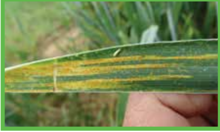
Sarı Pas ( Puccinia striiformis )